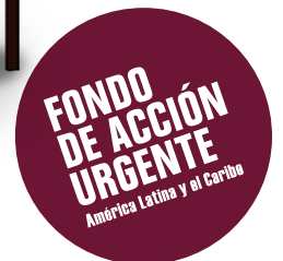
Ilustración: Fernando Higuera